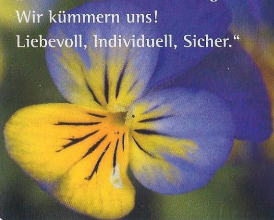
Ihr Friedhofsgärtner *

„Halten Sie die Erinnerung am Leben ... Wir kümmern uns! Liebevoll, Individuell, Sicher.“